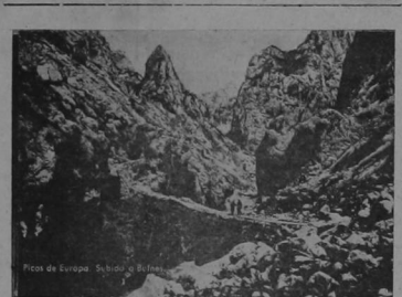
Paisaje en la región de los famosos Picos de Europa en la cordillera de Asturias, donde las fuerzas nacionalistas han logrado desalojar a los republicanos en su avance contra Gijón y Oviedo. El foto da una idea clara de las grandes dificultades que se presentan a las tropas en estas montañas, donde cada paso parece una fortaleza inexpugnable.

Los aeroplanos multimotora de servicio regular, aterrizan en Santa Ana, poblado menor que el de San José de Costa Rica, unos veinte minutos, de automóvil, en una carretera asfaltada. Santa Ana es un valle profundo en donde muchas veces la niebla no co-