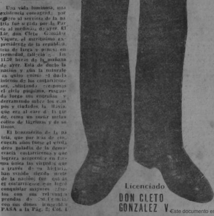
Licenciado DON CLETO GONZALEZ V.

Biografía del Licenciado Don Cleto González Viquez