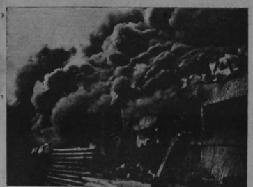
Millones de dólares en caños y perfiles fueron caudados por los proyectiles explosivos de la aviación japonesa al incendiar los grandes depósitos de gasoil en las afueras de Shanghai, pertenecientes a empresa norteamericana e inglesa.

Las actividades políticas, en los distintos sectores, han estado realizándose con toda actividad, según informes que ayer se fransan recoger en distintos puntos.